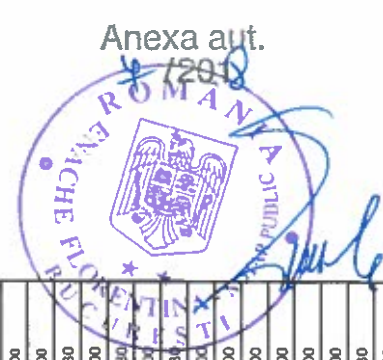
Anexa nr. 1 la Regulamentul Oficial al Campaniei publicitare „Castiga cu Marci de Top un TV LG LED HD (80cm)” derulata in perioada 10.05.2018 - 30.06.2018